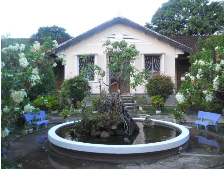
Nhà Thờ Chính Tòa Kontum (13 Nguyễn Huệ, Kontum)