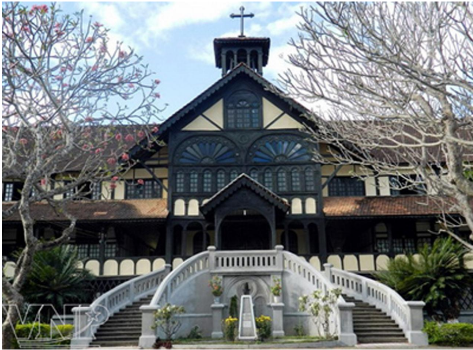
Trung Tâm Hành Hương Mẹ Măng Đen (Xã Đăk Long, huyện Kon Plông, Kontum)